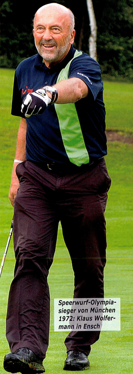
Speerwurf-Olympiasieger von München 1972: Klaus Wolfermann in Ensch