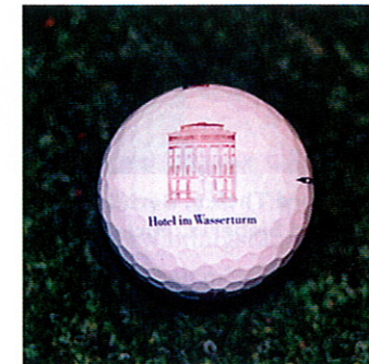
Eigens hergestellt: Logo-Ball

Schauplatz der Abendveranstaltung waren die Bankenträume des Hotels im Wasserturm