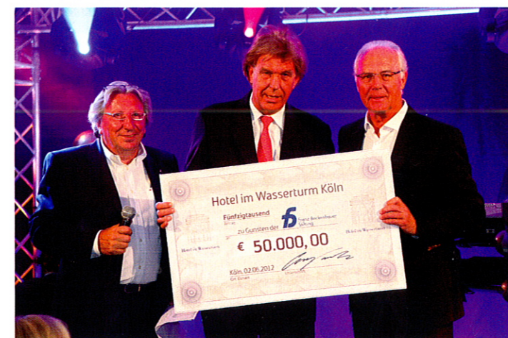
Scheckübergabe durch Manfred Thomas und Günter Pütz an Franz Beckenbauer

Der gelungene Auftakt gibt Anlass zu einer Fortsetzung der „Hotel im Wasserturm Trophy“, sodass man im nächsten Jahr wieder mit einer kaiserlichen Visite in Köln rechnen darf.