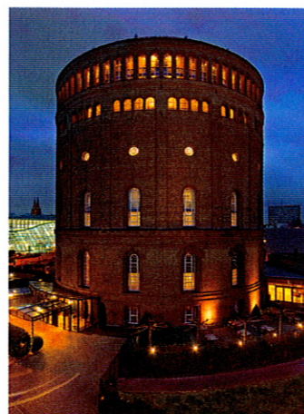
Hotel im Wasserturm